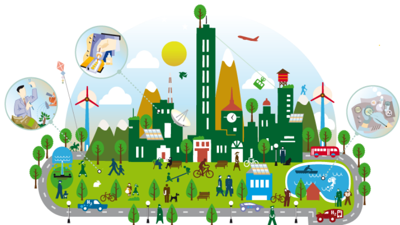
La Química encuentra soluciones para un mundo mejor